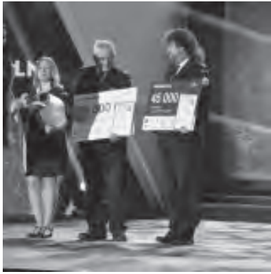
Vlevo zástupce Bludova, vpravo zástupce z Roštění